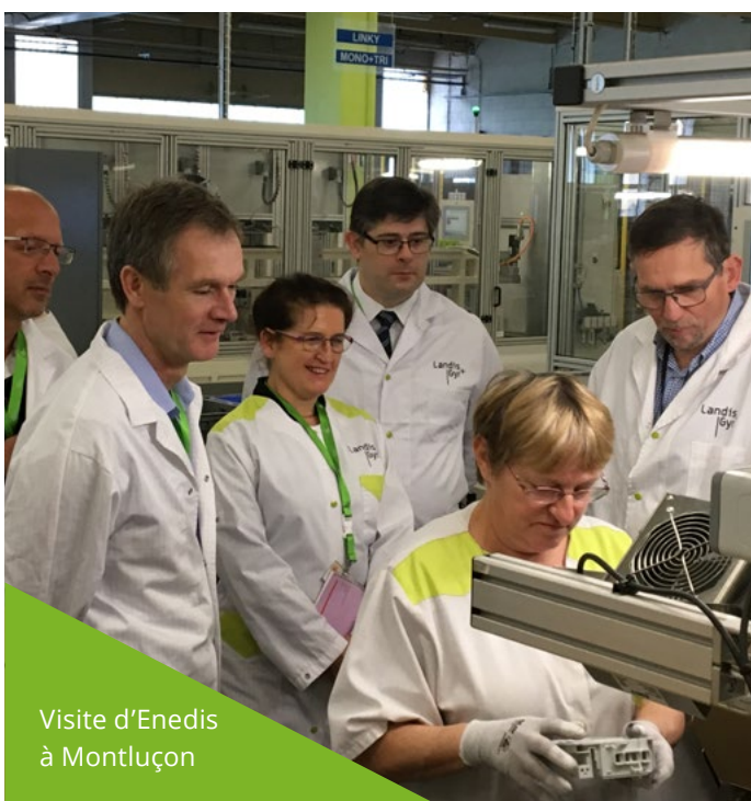
Visite d'Enedis à Montluçon